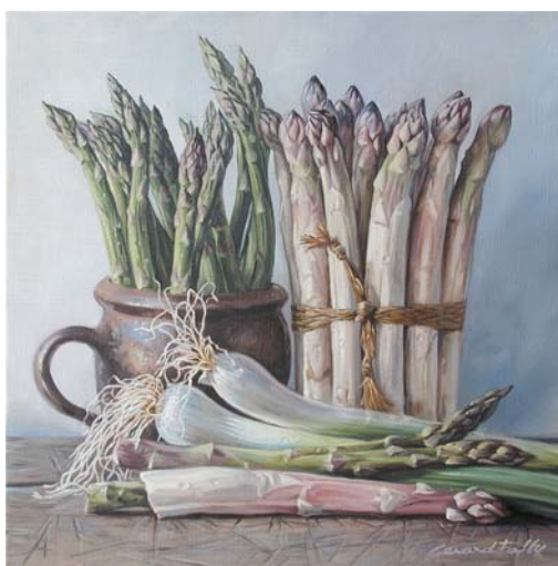
↑ Asperges et oignons blancs