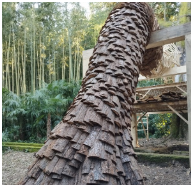
Grefe charpentière en cours de réalisation

L'installation confronte matière organique et construction humaine, souplesse et stabilité, dans un équilibre fragile entre rupture et résilience. Une œuvre qui permet d'explorer les notions de disparition et d'équilibre.